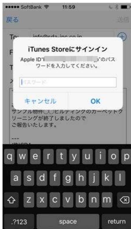
①パスワードの入力